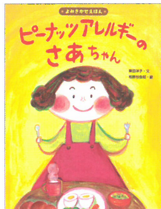
【ポプラ社電子書籍】【限定ソフトカバー版】 栗田洋子文 相野谷由起絵